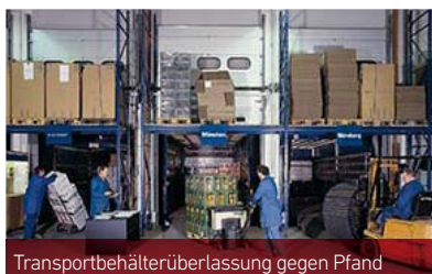
Transportbehälterüberlassung gegen Pfand

Warenumschiebungen liegen dagegen vor, wenn aufgrund der Eigenart einer Ware eine bestimmte Umschiebung erforderlich ist, um sie für den Endverbraucher verkaufs- und absatzfähig zu machen, beispielsweise Getränkeflaschen und -kisten. Die Einordnung des Transportbehältnisses muss auf allen Handelsstufen einheitlich sein.