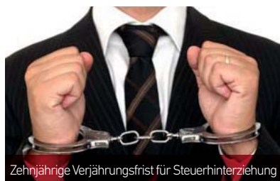
Zehnjährige Verjährungsfrist für Steuerhinterziehung

+ Verjährung: Vom ursprünglichen Plan, die strafrechtliche Verjährung für Steuerhinterziehung auf zehn Jahre zu verdoppeln, war die Bundesregierung schon früh wieder abgerückt. Damit bleibt es dabei, dass strafrechtlich nur für eine besonders schwere Steuerhinterziehung eine zehnjährige Verjährungsfrist gilt. In der Praxis müssen aber künftig auch bei einer einfachen Steuerhinterziehung die hinterzogenen Steuern für zehn Jahre rückwirkend nacherklärt werden, um Straffreiheit zu erreichen. Statt einer Verdopplung der Verjährungsfrist wurde nämlich einfach ein Berichtigungszeitraum von zehn Jahren als Voraussetzung für die Straffreiheit festgeschrieben. Steuerlich galt zwar schon immer eine zehnjährige Verjährungsfrist, allerdings musste der Steuerzahler zu den strafrechtlich bereits verjährten Jahren bisher keine Angaben machen. Das Finanzamt musste die Angaben daher schätzen, sofern es Anhaltspunkte für eine Steuerhinterziehung auch vor dem angezeigten Zeitraum von fünf Jahren gab.