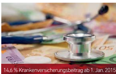
14,6 % Krankenversicherungsbeitrag ab 1. Jan. 2015