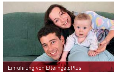
Einführung von ElterngeldPlus