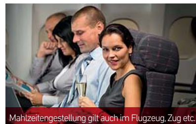
Mahlzeitengestellung gilt auch im Flugzeug, Zug etc.