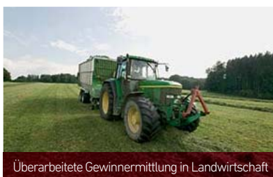
Überarbeitete Gewinnermittlung in Landwirtschaft