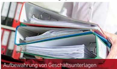
Aufbewahrung von Geschäftsunterlagen

Um die zu erwartenden Aufwendungen für die Aufbewahrung von Geschäftsunterlagen abzudecken ist in der Handels- und Steuerbilanz eine Rückstellung für ungewisse Verbindlichkeiten zu bilden, weil für die Unterlagen eine gesetzliche Aufbewahrungspflicht besteht. Wie diese Rückstellung zu berechnen ist, hat