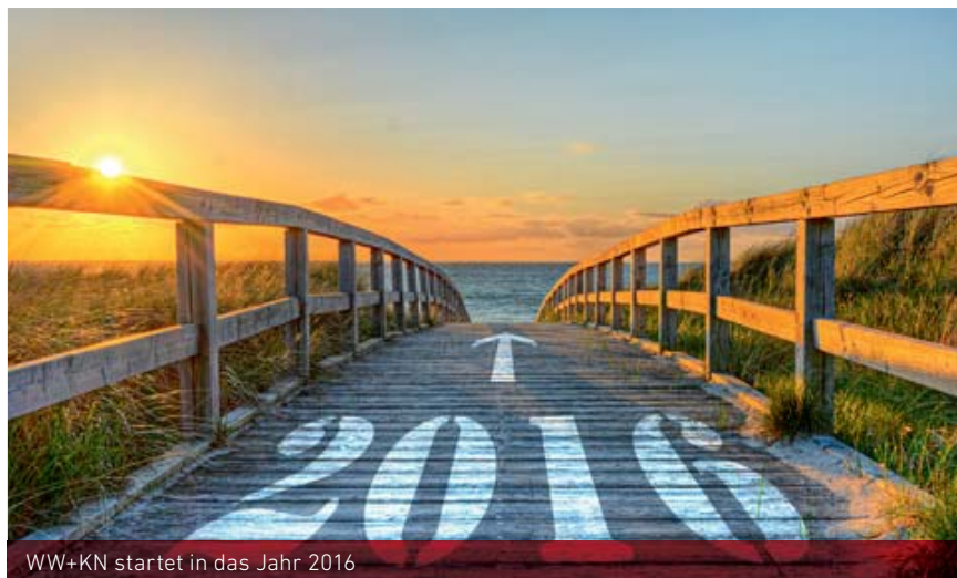
WW+KN startet in das Jahr 2016