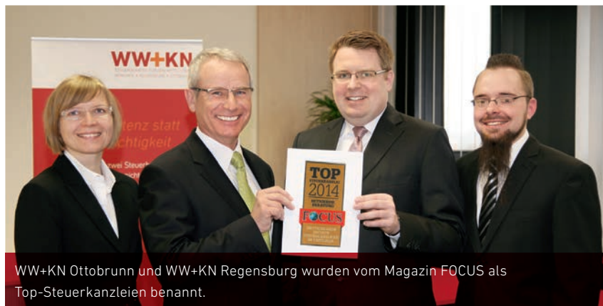
WW+KN Ottobrunn und WW+KN Regensburg wurden vom Magazin FOCUS als Top-Steuerkanzleien benannt.