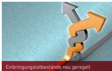
Einbringungstatbestände neu geregelt

+ Einbringungstatbestände: Rückwirkend zum 1. Januar 2015 werden verschiedene Steuergestaltungen im Zusammenhang mit Einbringungen ausgehebelt. Eine steuerneutrale Umstrukturierung ohne Aufdeckung von stillen Reserven ist dann nur noch möglich, wenn die zusätzlich zu neuen Gesellschaftsanteilen gewährten sonstigen Gegenleistungen nicht mehr als 25 % des Buchwerts der eingebrachten Wirtschaftsgüter oder nicht mehr als 500.000 Euro ausmachen. Über diesen Grenzen kommt es zu einer anteiligen Aufdeckung der stillen Reserven.