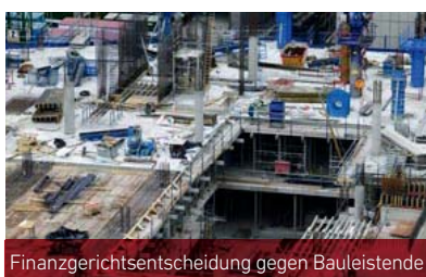
Finanzgerichtsentscheidung gegen Bauleistende

Bisher haben zwei Finanzgerichte bei der rückwirkenden Änderung der Steuerschuldnerschaft auf Bauleistungen den betroffenen Bauunternehmen eine Aussetzung der Vollziehung gewährt. Inzwischen gibt es zwei weitere Entscheidungen von anderen Finanzgerichten, die für Bauleistende nicht so erfreulich sind.