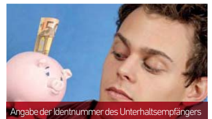
Angabe der Identnummer des Unterhaltsempfängers